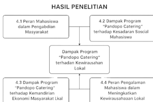
Gambar 2. Hasil pembahasan

Gambar dibawah ini menunjukkan peran aktif mahasiswa dalam program "Pandopo Catering" yang berfokus pada pelatihan kewirausahaan, peningkatan kesadaran sosial, dan pemberdayaan ekonomi masyarakat lokal melalui kegiatan pengabdian masyarakat.