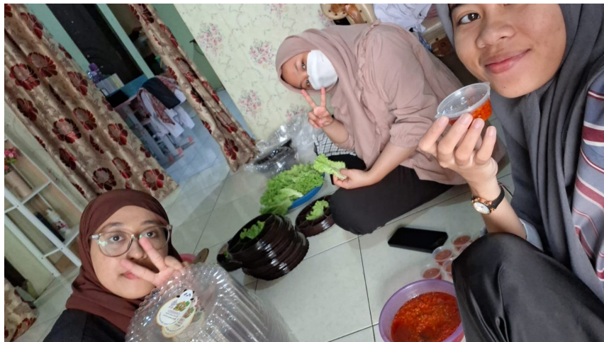
Gambar 1. Dokumentasi Pengabdian Mahasiswa Dalam Kegiatan Pandopo Catering

Berdasarkan Gambar 1 mahasiswa memiliki potensi yang besar untuk berperan aktif dalam pengabdian masyarakat, terutama dalam konteks pemberdayaan ekonomi dan sosial. Mahasiswa dapat membawa perspektif baru dan ide-ide kreatif dalam program pengabdian masyarakat, yang membantu mengatasi tantangan ekonomi dan sosial yang ada di komunitas [8]. Melalui pendekatan yang lebih berbasis pada solusi jangka panjang, mahasiswa dapat memfasilitasi pengembangan keterampilan praktis di masyarakat, serta memberikan motivasi dan dukungan untuk mengembangkan usaha yang lebih mandiri dan berkelanjutan. Partisipasi mahasiswa dalam program pengabdian masyarakat dapat memicu transformasi sosial di tingkat lokal. Selain meningkatkan kemandirian ekonomi masyarakat, mahasiswa juga dapat berperan sebagai agen perubahan yang