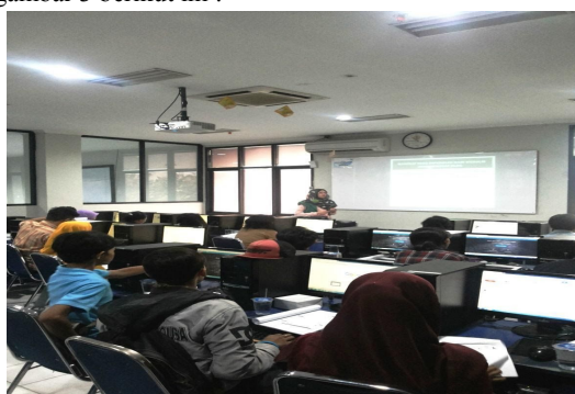
Gambar 3. Pemaparan materi membuat blog

Adapun tools yang digunakan dalam membuat blog adalah Wordpress dengan materi yang diajarkan : syarat membuat blog, teori dalam penggunaan Wordpress, cara mendaftarkan akun di Wordpress, memulai penggunaan Wordpress, memilih themes , cara memposting informasi didalam blog, menambahkan widjet dan memodifikasi blog. Untuk kegiatan pemaparan teori dalam membuat blog dapat dilihat pada gambar 3 berikut ini :