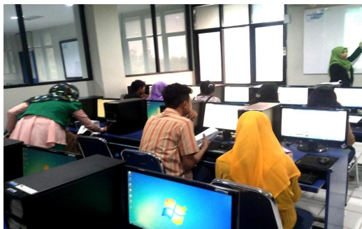
Gambar 2. Pemaparan materi internet

Adapun tools yang digunakan dalam membuat blog adalah Wordpress dengan materi yang diajarkan : syarat membuat blog, teori dalam penggunaan Wordpress, cara mendaftarkan akun di Wordpress, memulai penggunaan Wordpress, memilih themes , cara memposting informasi didalam blog, menambahkan widjet dan memodifikasi blog. Untuk kegiatan pemaparan teori dalam membuat blog dapat dilihat pada gambar 3 berikut ini :