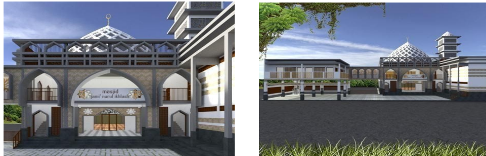
Gambar 4. Rancangan Pembangunan