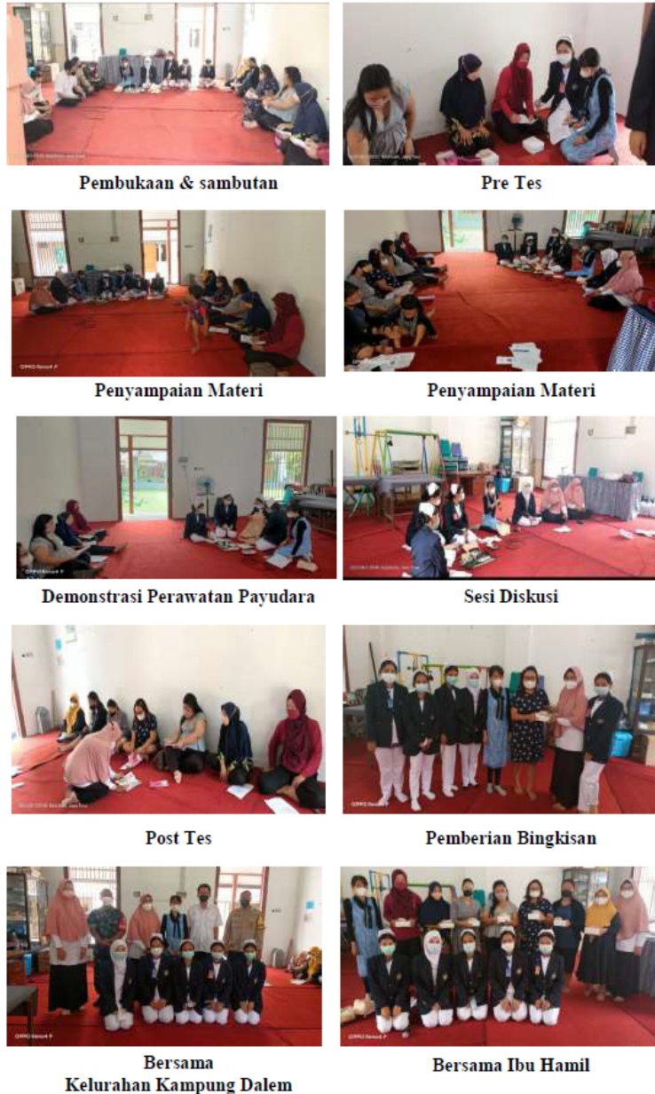
Gambar 2. Kegiatan Penyuluhan

Program pengabdian kepada masyarakat yang berupa pemeriksaan kesehatan, konseling dan penyuluhan kesehatan mengenai “Teknik Perawatan Payudara dan Manfaat ASI”, dapat meningkatkan pengetahuan ibu hamil tentang : pengertian perawatan payudara, tujuan perawatan payudara, manfaat perawatan payudara, pengertian ASI, manfaat ASI, persiapan alat perawatan payudara dengan lengkap dan benar dan melaksanakan cara perawatan payudara dengan benar [7]. Melalui kegiatan ini ibu hamil dapat mengambil keputusan dalam memanfaatkan fasilitas layanan kesehatan di masyarakat khususnya di Kelurahan Kampung Dalem kota Kediri dalam upaya memaksimalkan cakupan ASI eksklusif. Hal tersebut terbukti dari Rekap hasil Kuesioner sebelum dan sesudah diberikan penyuluhan [8]. Sebelum diberikan penyuluhan sebanyak 3 ibu hamil (30%) dengan pengetahuan baik dan setelah kegiatan terdapat peningkatan menjadi 8 ibu hamil (80%) dengan pengetahuan baik. Hal ini menunjukkan peserta sangat antusias untuk meningkatkan pengetahuan mereka tentang pentingnya edukasi teknik perawatan payudara dan manfaat ASI [9].